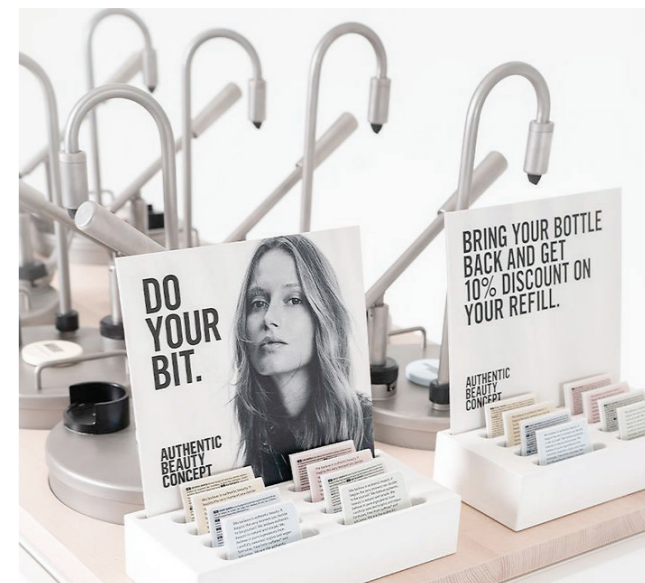
Refillbar Authentic Beauty Concept